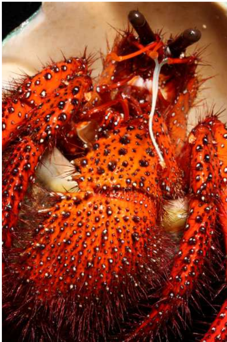
Dardanus megistos , Moorea, spécimen en collection CRIOBE

1) Institut de Recherche, Ecole navale et groupe des écoles du Poulmic, CC 600, 29240 Brest Cedex 9, France, joseph.poupin@ecole-navale.fr